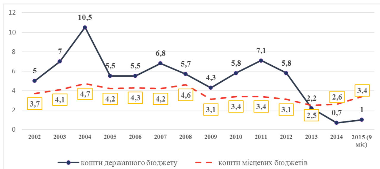
Рис. 2. Частка державного та місцевих бюджетів у структурі джерел фінансування інвестицій в основний капітал, %

Стосовно обсягу та динаміки державних інвестицій в основний капітал варто зазначити, що найбільшою їх частка у загальній структурі джерел фінансування інвестицій в основний капітал була у 2004 р. – 10,5% (рис. 2.). У 2009-2011 рр. спостерігалась активізація державних інвестиційних вкладень, за три роки їх сума збільшилась у двічі з 10848 млн. грн. до 21710 млн. грн., що було пов'язано передусім із реалізацією інфраструктурних проектів за рахунок бюджетних асигнувань до ЄВРО-2012.