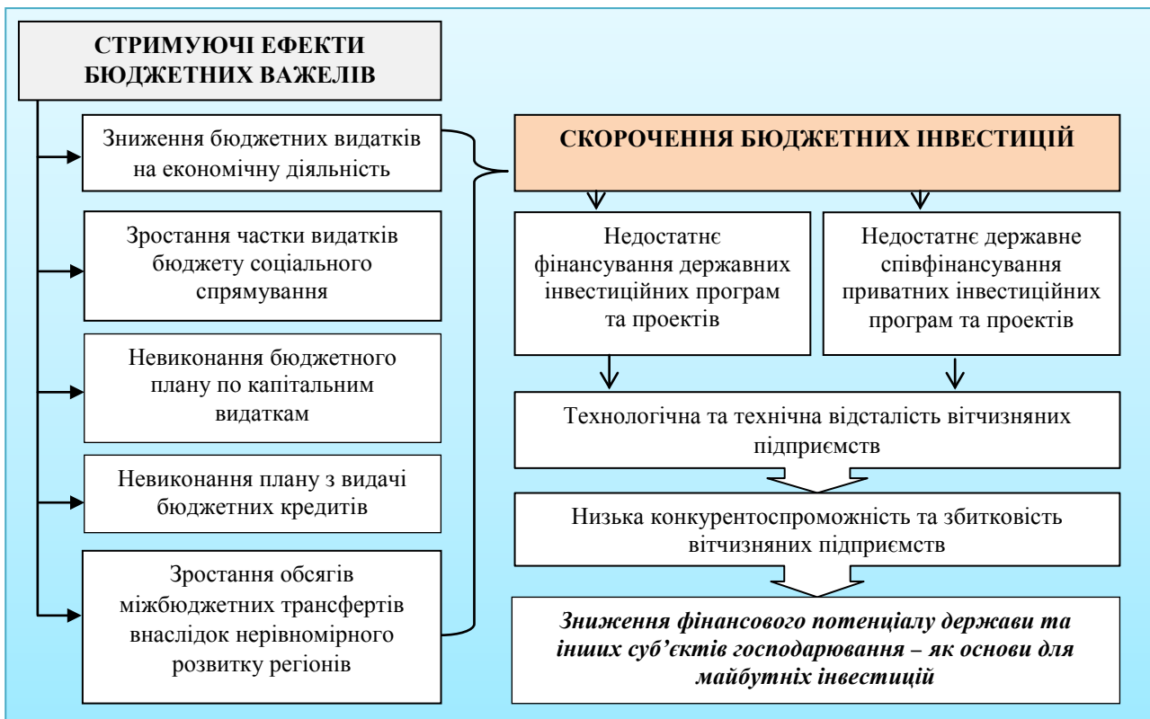
Рис. 4. Стримуючі ефекти бюджетних важелів на активізацію інвестиційного процесу

соціально-економічні процеси, дотримуватися визначених пріоритетів із застосуванням важелів, властивих ринковій економіці.